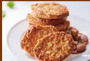
▲ 軽井沢ラスクキャラメルアーモンド