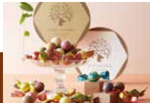
▲ 軽井沢チョコレートボール