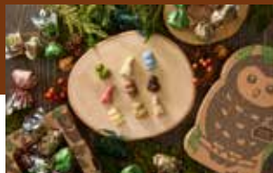
▲ 軽井沢カオチャーム